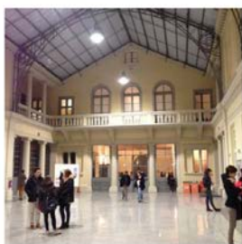
XLI AICAT-GICAT Conference's venue